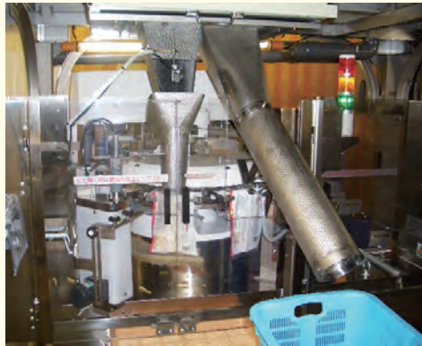
自動計量包装機 (CPS) による選別・袋詰め作業