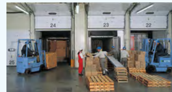
ドックボード・エアシェルター