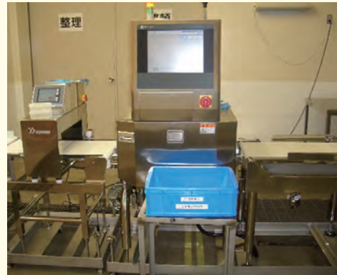
X 線異物検査機・大型金探機