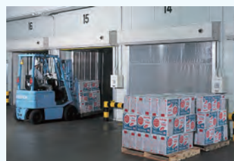
ドックシェルター（出庫）