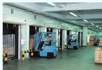
ドックシェルター（入庫）

その他 保税蔵置場 動物検疫指定倉庫 一部普通倉庫 バーコードシステムによる商品管理 構内無線LANシステムによる入出庫在庫管理 ドックシェルター 12カ所 オーバースライダー 20カ所 冷凍コンテナーコンセント 10カ所 荷捌き場低温化