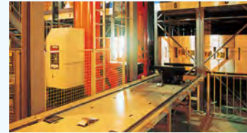
完全自動化倉庫内部