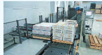
ピッキングステーション