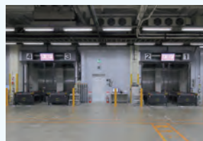
自動倉庫入出庫レーン