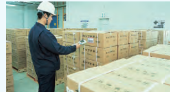
バーコードシステム