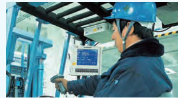
構内無線 LAN システム